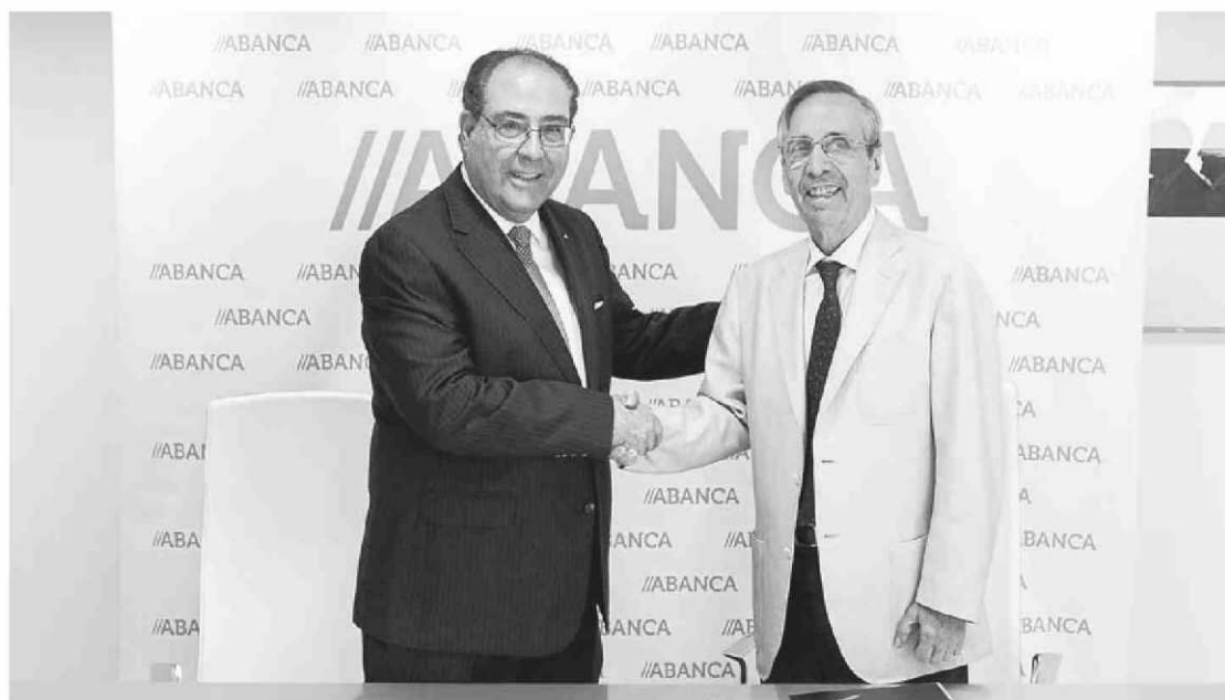
Representantes de Abanca y AECA suscribieron ayer el acuerdo en A Coruña

La cátedra AECA-Abanca desarrollará su actividad fundamentalmente en Galicia, aunque