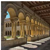
Abadía Benedictina de Santo Domingo de Silos