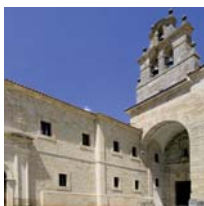
Hospedería de San Francisco