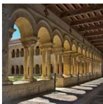
Abadía Benedictina de Santo Domingo de Silos