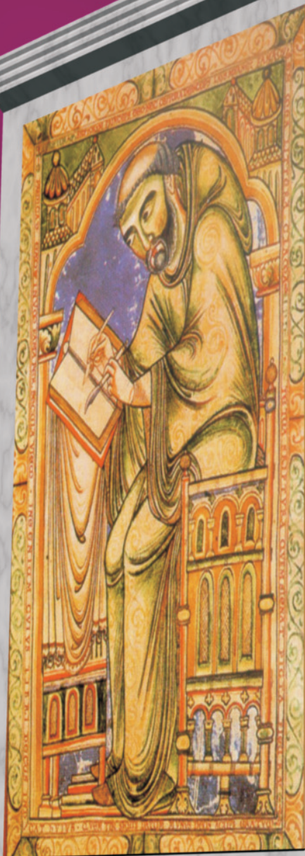
Beato de Liébana San Miguel de Escalada. Siglo X

Reino de León: Las cuentas de 1100 años de historia