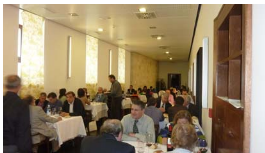
Almuerzo en la Hospedería de San Francisco