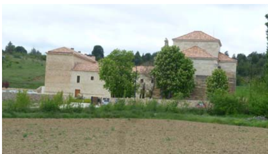
Convento de San Francisco. Sede de la Jornada