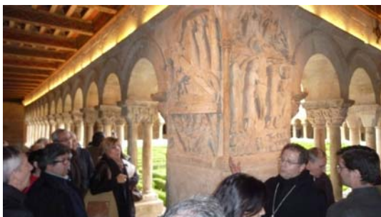
Lorenzo Maté guía la visita de los asistentes