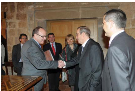
Luis María Linde y Leandro Cañibano