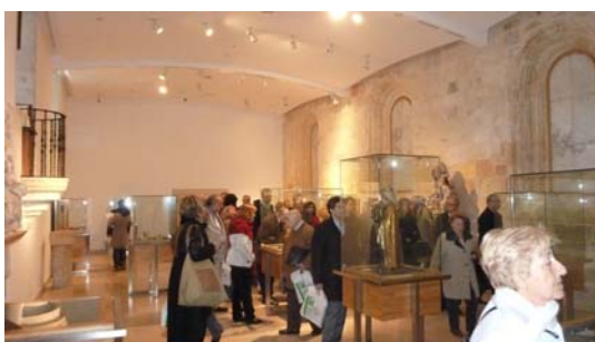
Museo del Monasterio