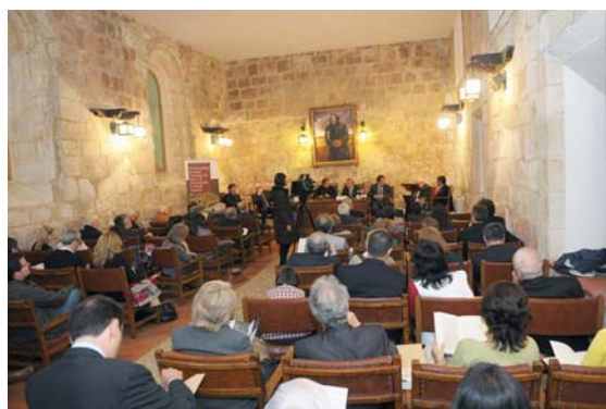
Aspecto de la sala San Benito (Monasterio de Santo Domingo de Silos)