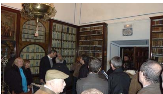
Su botica alberga una biblioteca especializada