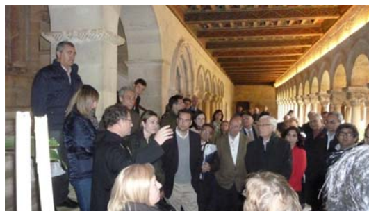
Claustro del Monasterio de Santo Domingo de Silos