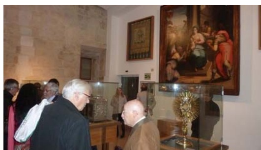
El Monasterio exhibe una importante colección de obras de arte: pintura, orfebrería, escultura y esmalte