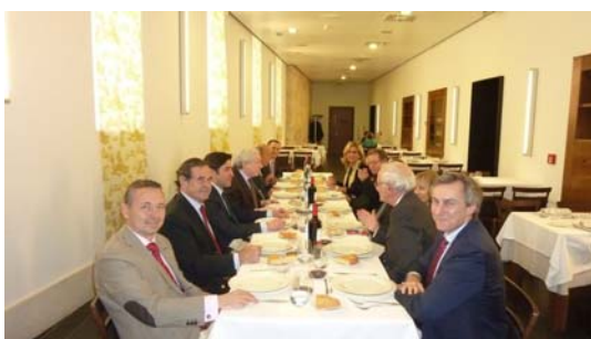
Almuerzo-reunión de la junta Directiva de AECA