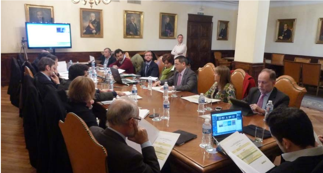
Reunión del grupo de trabajo de la Comisión de RSC de AECA sobre empresa social.