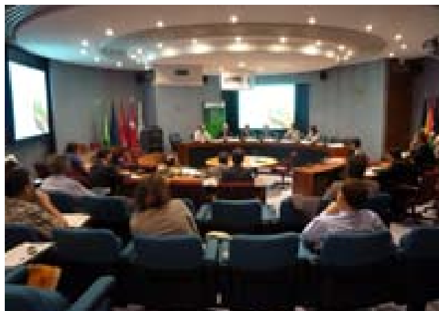
Jornada "Informar y Verificar sobre RSC. Algunas referencias para las Pymes". Madrid, 30 de junio de 2010.