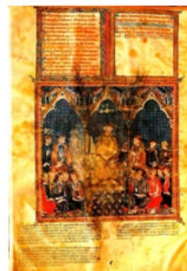
Manuscrito de la Primera Crónica General de España , de Alfonso X (1260)

en la misma Basílica, en su hospedería, la “Casa de la Espiritualidad”. Para los que deseen hospedarse en el casco antiguo se gestionarán plazas de hotel. Los actos académicos del Encuentro constarán de siete conferencias plenarias y de las sesiones paralelas necesarias para que sean expuestas las comunicaciones que sean enviadas y aceptadas para su presentación. La conferencia inaugural se celebrará en la Sala del Milagroso Pendón de Baeza. La historia del Milagroso Pendón de Baeza se remonta al verano del año de 1147. En plena reconquista el emperador Alfonso VII se vio detenido en los escarpes de Baeza, cuando avanzaba con sus tropas hacia Almería. Según la Primera Crónica General de España , compuesta por el Rey Alfonso X el Sabio, estando las huestes leonesas a punto de levantar el cerco por disensiones internas, intervino San Isidoro, que se apareció en sueños al emperador y le dijo: “¿Por qué dudas? Esa multitud de moros, en amaneciendo, huirá delante de ti,