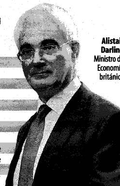
Alistair Darling Ministro de Economía británico