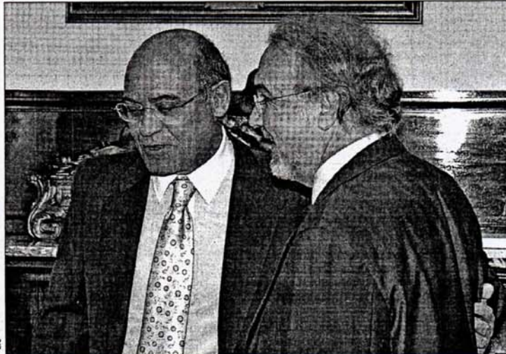
El presidente de CEOE, Gerardo Díaz Ferrán, con el vicepresidente económico en funciones, Pedro Solbes.

Las empresas realizan tres pagos a cuenta de Sociedades; el primero, toca realizarlo entre el 1 y el 20 de abril (los otros dos, en los meses de octubre y diciembre). La ley del impuesto establece dos sistemas para calcular este pago fraccionado: la norma general dice que será según el resultado contable del trimestre, pero las empresas que facturen menos