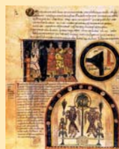
Folio del Codex Vigilanus con dibujos representando Noé con sus hijos; el mapamundi conocido entonces; y el paraíso