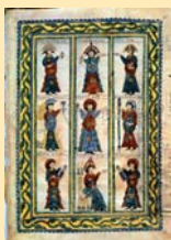
Codex Emilianensis (992), con la imagen de algunos reyes visigodos