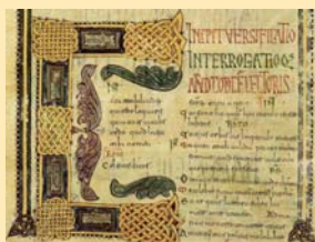
Folio con hermosa letra capital