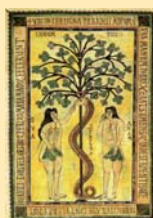
Dibujo de Adán y Eva en el Codex Vigilanus (976).